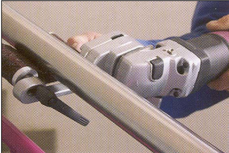
ROHR-FIX HIOO JA KIILLOTAA MYÖS PUTKEN ALAPINNAN HELPOSTI.