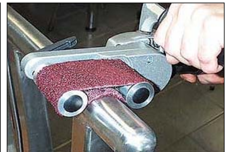
ROHR-FIX HIOO JA KIILLOTAA.