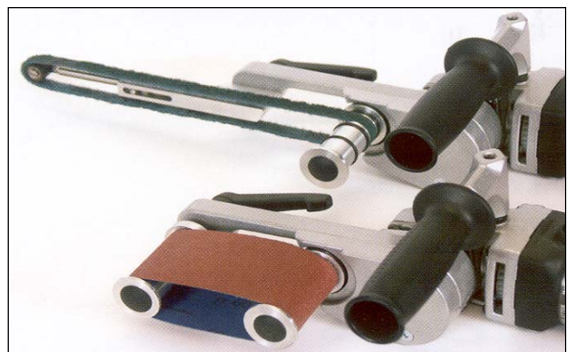
YKSI KONE ROHR-FIX JA KOLME KÄYTTÖTAPAA.