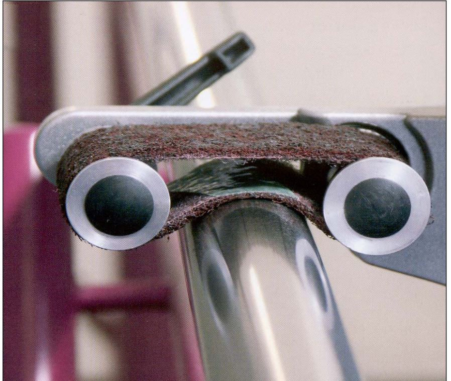
ROHR-FIX HIOO MATTA / SATIINIPINTAA.