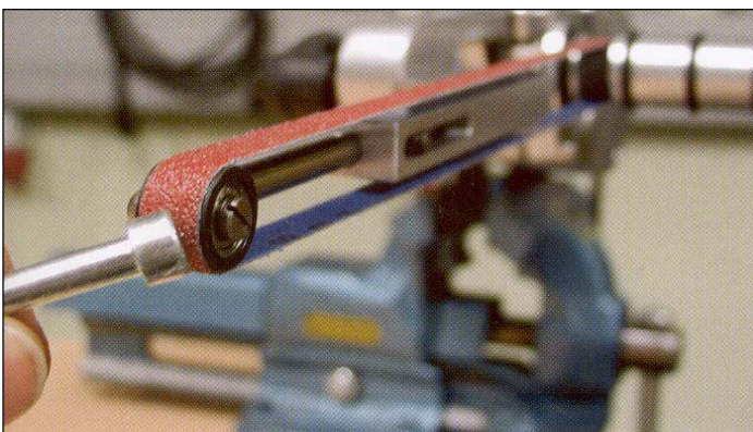
ROHR-FIX ON KIINNITETTY TYÖKALUPITIMELLÄ RUUVIPENKKIIN JA VAIHTOPÄÄLLÄ HIOTAAN JA KIILLOTETAAN PIENIÄ OSIA.