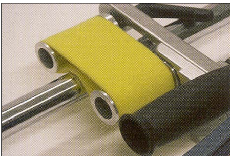
SUPER KIILLOTUSLENKILLÄ JA POLYCREME VAHALLA SAADAAN PEILIPINTAA.