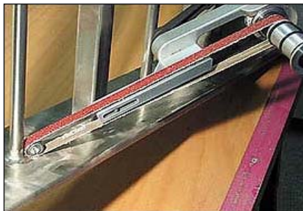
ROHR-FIX KAPEALLA VAIHTOPÄÄLLÄ PÄÄSTÄÄN HIOMAAN JA KIILLOTTAMAAN VAIKEITAKIN PAIKKOJA.