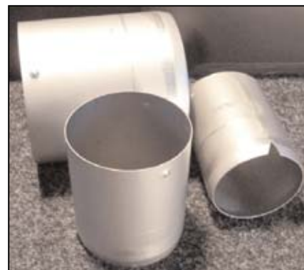
T.I. PE-TUKIPUTKI DIN 8074 MUKAAN ALUE: 50-355 mm PITUUS: 100, 120, 140, 160 mm