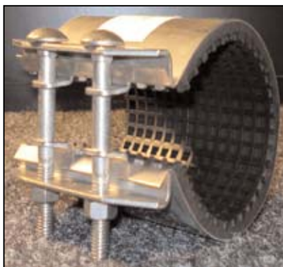
TQ10 1-OSAINEN PANTA PAINE: 16 / 10 / 6 BAR ALUE: 15-329 mm PITUUS: 60, 100 mm