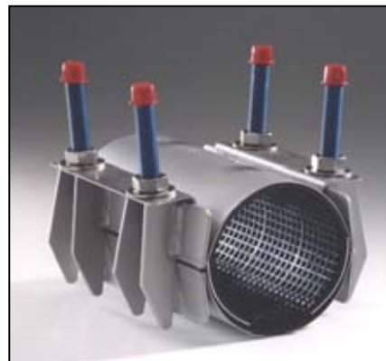
TS20 2-OSAINEN PANTA PAINE: 16/10/6/4/3 BAR ALUE: 88-855 mm PITUUS: 200, 250, 300, 400, 500, 600, 800 mm