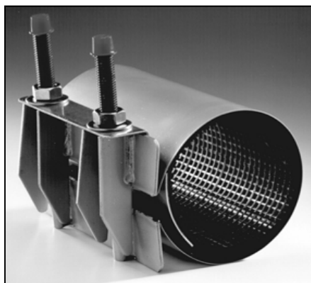
TS10 1-OSAINEN PANTA PAINE: 20 / 16 / 10 BAR ALUE: 20-360 mm PITUUS: 100, 150, 200, 250, 300, 400, 500, 600 mm

RAKENNE ON 100 % RUOSTUMATONTA TERÄSTÄ AISI304 TAI AISI316 SISÄMATERIAALIKUMI: NBR / EPDM JA VITON. ALLA ILMOITETTU MAKSIMI KÄYTTÖPAINO ON VEDELLE. PULTIT OVAT TEFLONOITUJA HELPOTTAMAAN MUTTERIN LIIKETTÄ.