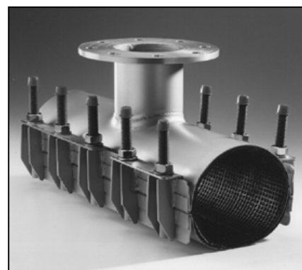
TT20 2- TAI 3-OSAINEN PANTA PAINE: 16/10/6 BAR ALUE: 88-798 mm LAIPPAKOKO: DN50-DN300 PITUUS: 300, 400, 500, 600, 700 mm