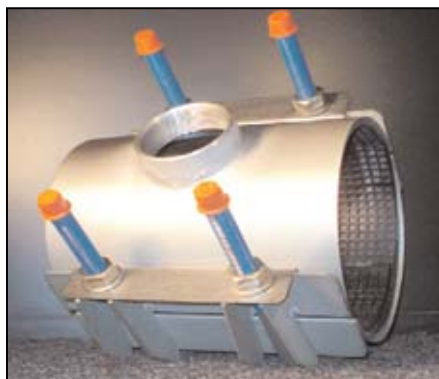
TG HUOLTOMUHVIT 1-, 2- JA 3-OSAISIA PANTOJA PAINE: 16 BAR 1/2" - 4" BSP ULOSOTOILLA MYÖS MUUT KIERTEET