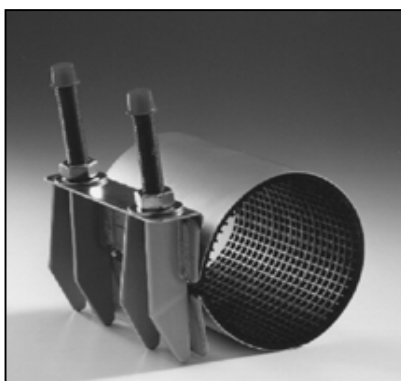
TC10 1-OSAINEN PANTA PAINE: 16 BAR ALUE: 20-276 mm PITUUS: 150, 200, 250, 300 mm