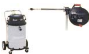
SAM - 3A - 15 - KIT IMURI 57 l