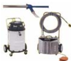
RAM-4X2A-15-KIT SÄILIÖ 57 l