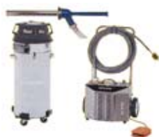
RAM-4X2A-20-KIT SÄILIÖ 76 l

230V, 50 Hz. TAIPUISAN AKSELIN NOPEUS 1725 RPM, NOPEUS VOIDAAN LASKEA 862 RPM JA SAADAAN SUUREMPI VÄÄNTÖ. MOOTTORIN TEHO: 2 HP, PAINO: 35 kg