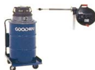
SAM - 3A - 55 - KIT IMURI 208 l