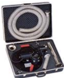
SC-682 SAM 3 + VARUSTUS