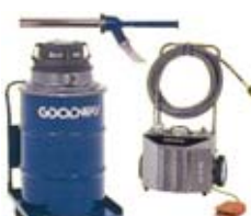
RAM-4X2A-30KIT SÄILIÖ 114 l RAM-4X2A-55KIT SÄILIÖ 208 l