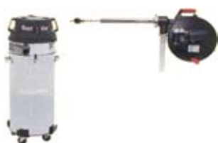
SAM - 3A - 20 - KIT IMURI 76 l