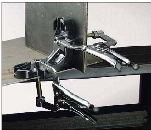
PT-KULMASYSTEEMI KAHDELLA PIHDILLÄ TUOTENRO KUVAAUS PT622 SISÄLTÄÄ T-TUEN PXT6 JA KAKSI PG622M PIHTIÄ.