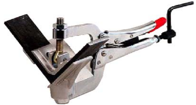
PL-KULMASYSTEEMI TUOTENRO KUVAAUS PL622 SISÄLTÄÄ L-TUEN PXL6 JA PG622M PIHDIN.