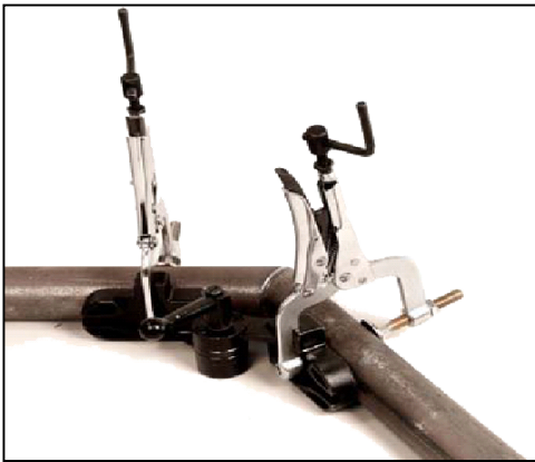
PA-KULMASYSTEEMI KAHDELLA PIHDILLÄ TUOTENRO KUVAAUS PA622 SISÄLTÄÄ SÄÄTÖTUEN 0-180° PXA6 JA KAKSI PG622M PIHTIÄ.