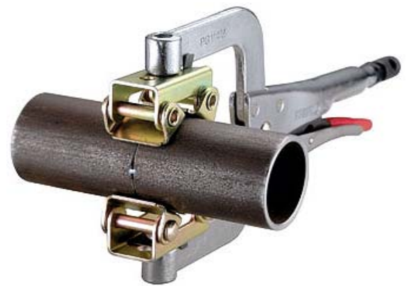
PG-PUTKIKESKITINPIHDIT KOOT JA KUVAAUS EDELLISELLÄ SIVULLA.