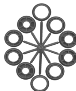
H / HOLKKISARJA R / HOLKKISARJA

F / MONIREIKÄ = 13 - 16 - 20 - 22 - 26 - 30 - 40 - 50 mm H / HOLKKISARJA = 32/ 12,7 - 15,9 - 19 - 22,2 - 25,4 mm R / HOLKKISARJA = 32/ 12 - 16 - 20 - 22 - 25 mm